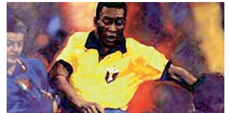
Die „göttliche Perle“ Pelé – Gemälde

Strategie heißt langfristig zu denken oder wie Sepp Herberger zu sagen pflegte: Ein Spiel dauert 90 Minuten! Oft sind die Mannschaften schon nach